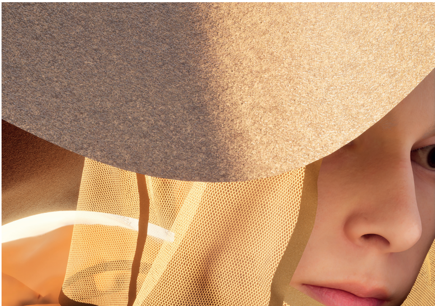
Lito Kattou, South Eastern South , 2025. 4K software based real-time algorithmic video. HD sound, still image