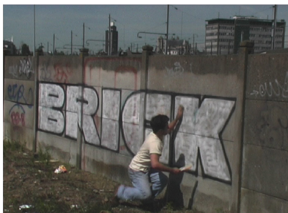
Régis Perray, Nettoyer « BRICK » de la série Malakoff / Pré-Gauchet , 2002