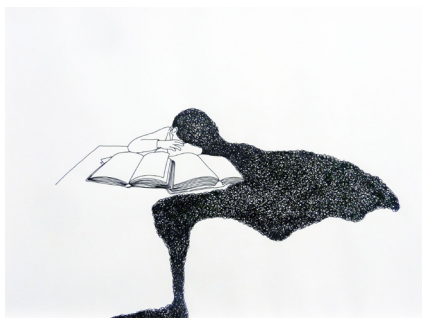
Mrzyk & Moriceau, Sans titre , 2005