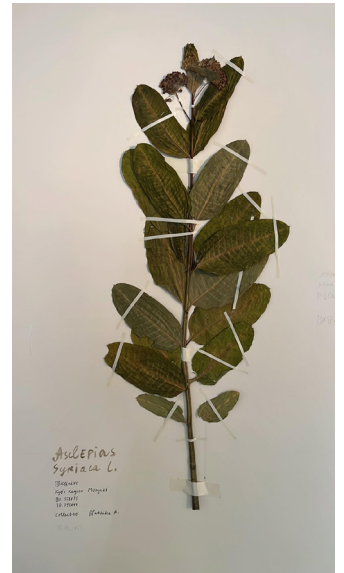
Alevtina Kakhidze, Invasions , 2022 Collection du Frac des Pays de la Loire