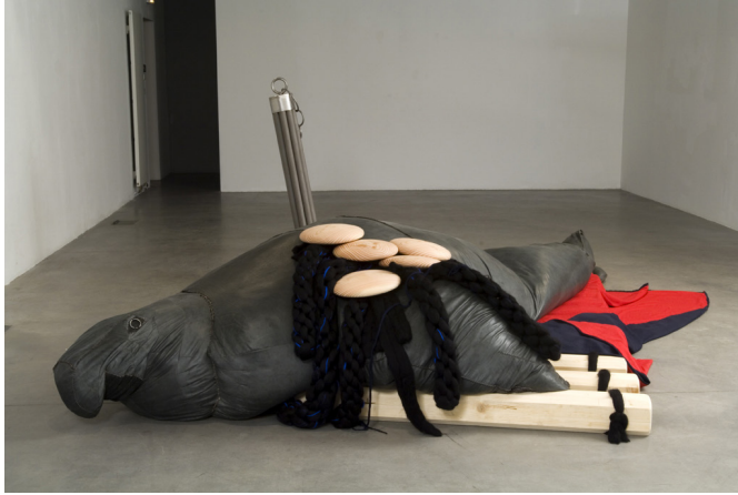
Dewar & Gicquel, Ukiyo-E , 2006 Œuvre de la collection du Frac des Pays de la Loire