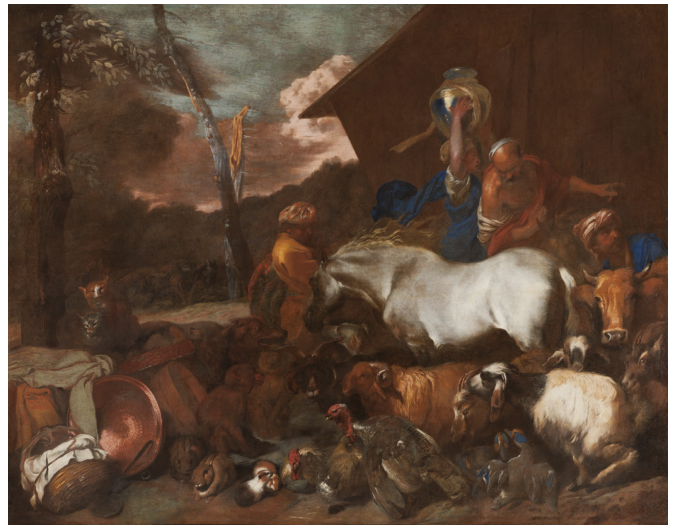
Giovanni Benedetto CASTIGLIONE dit IL GRECHETTO, Entrée dans l'arche , XVIème siècle Collection du Musée d'arts de Nantes