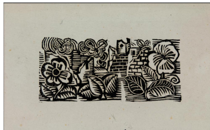
Raoul Dufy, Fleurs dans les ruines , 1918 Collection du Musée d'arts de Nantes