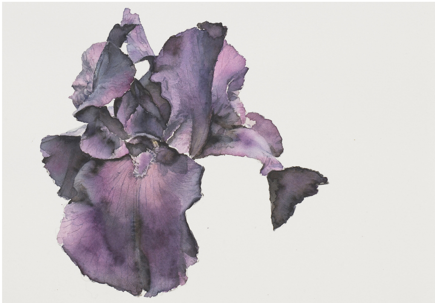
Patrick Neu, Iris , 2002. Collection du Frac des Pays de la Loire