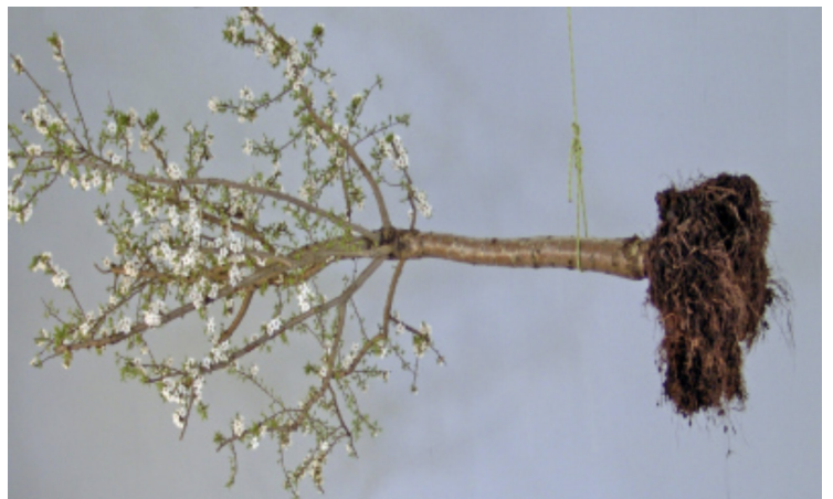
Jean-Claude Ruggirello, Jardin égaré , 2007 Collection du Musée d'arts de Nantes