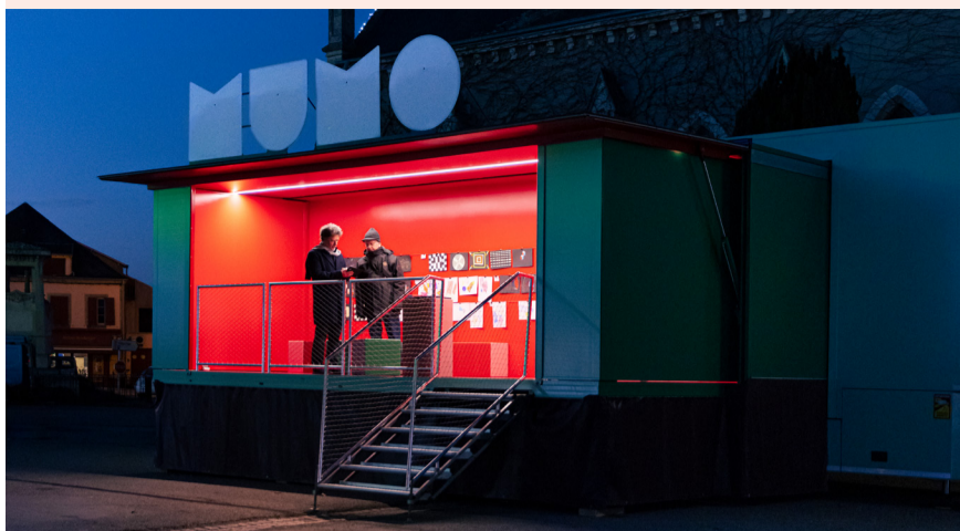
Le MuMo x Centre Pompidou conçu par Hérault Arnod Architecture et Krijn de Koning, artiste

Fabrice Rigoulet-Roze, Préfet de la région Pays de la Loire