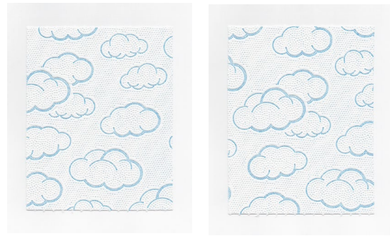
Pierre-Lin Renië, Nuages#7, Nuages#8 2021