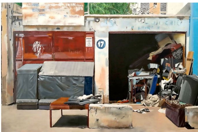
Cheikh Ndiaye, Atelier Tapissier Mamadou Ndiaye , 2017