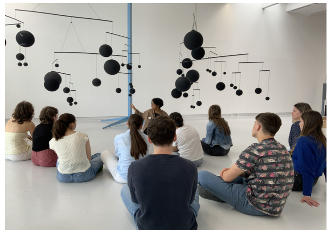
Visite d'une exposition au Frac, site de Nantes

Les établissements engagés dans le dispositif sont accueillis au Frac, à Carquefou, à Nantes ou dans les expositions en région pour des visites accompagnées. Les visites, au cœur du dispositif L'ART EN VALISE, favorisent la rencontre directe avec les œuvres, renforcent ou initient la fréquentation des lieux culturels, éloignés ou proches de l'environnement quotidien des élèves.