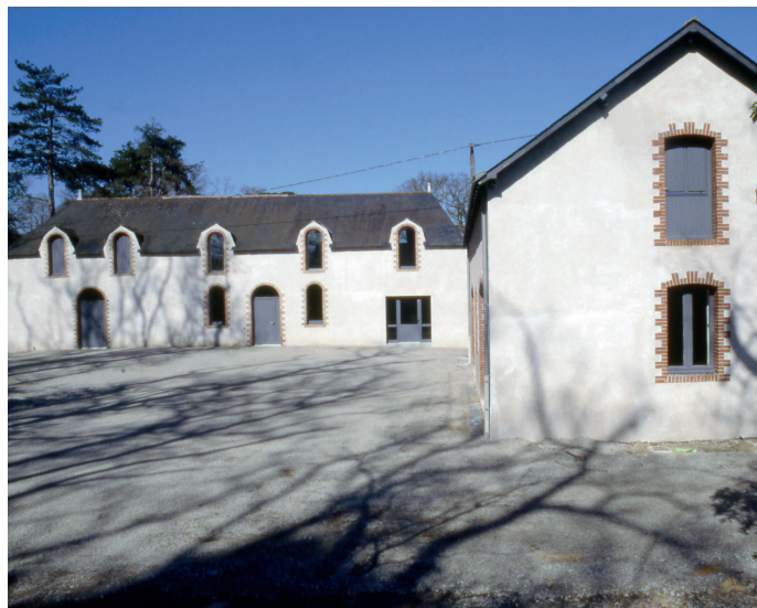
les résidences d'artistes du Frac, site de Carquefou

Depuis 1984, parallèlement à sa mission de collection et de promotion de l'art des artistes émergents et confirmés, le Frac des Pays de la Loire propose un programme de résidence d'artistes appelé Ateliers Internationaux où des artistes contemporain·es sont invité·es à séjourner et à créer des œuvres sur place. Cette période de recherche et de création est suivie d'une exposition et accompagnée de la production d'un catalogue. Bénéficiant d'un lieu dédié avec trois ateliers, cinq studio-logements et un espace de vie et de rencontre, le Frac – qui est implanté à Carquefou, dans un écrin de verdure – réunit les conditions idéales pour la mise en place d'une résidence d'artistes et la réalisation d'un projet commun inédit.