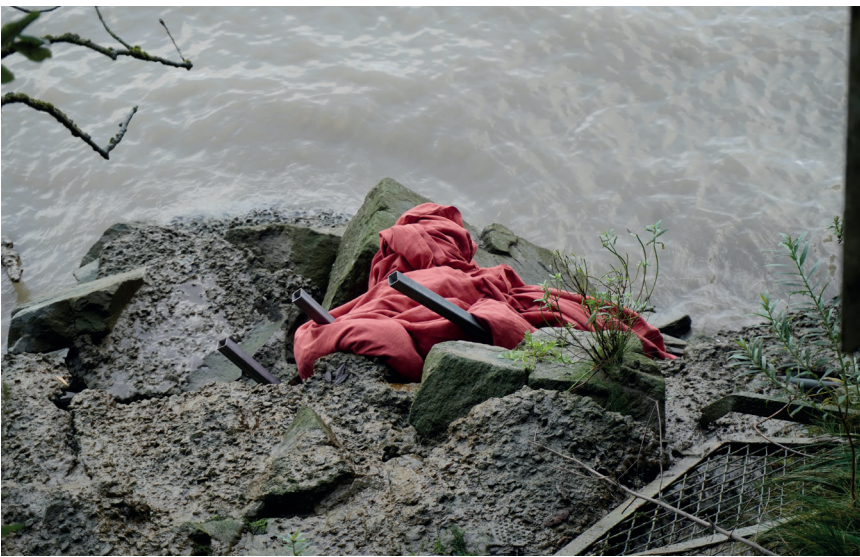
Jota Mombaça, Sculpture sinking . Nantes 2023.