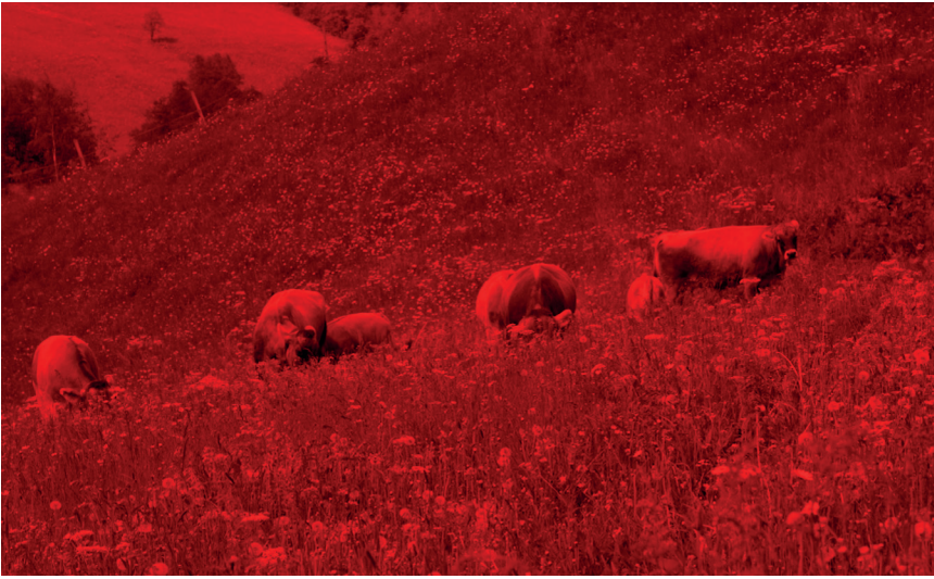
Ohan Breiding, still from Belly of a Glacier , 2023