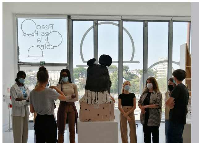
Visite d'une exposition au Frac, site de Nantes

Les établissements engagés dans le dispositif sont accueillis au Frac, à Carquefou, à Nantes ou dans les expositions en région pour des visites accompagnées. Les visites, au cœur du dispositif L'ART EN VALISE, favorisent la rencontre directe avec les œuvres, renforcent ou initient la fréquentation des lieux culturels, éloignés ou proches de l'environnement quotidien des élèves.