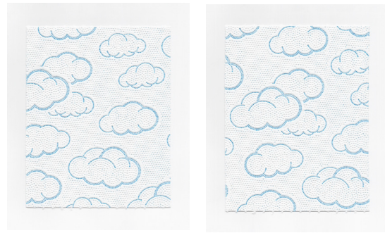
Pierre-Lin Renié, Nuages#5, Nuages#6 2021