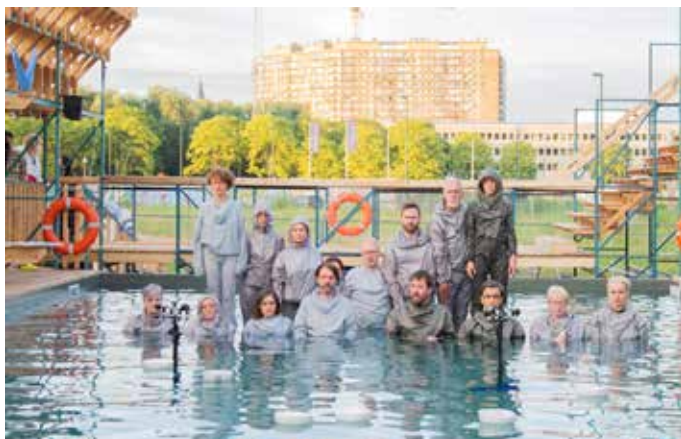
Lina Lapelytė, What happens with a dead fish ? , 2021 video still, Kunstenfestivaldesarts, Brussels