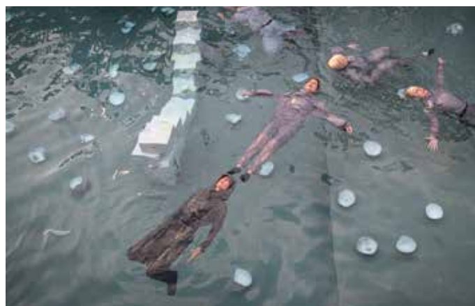
Lina Lapelytė, What happens with a dead fish ? , 2021 Biennale de Kaunas