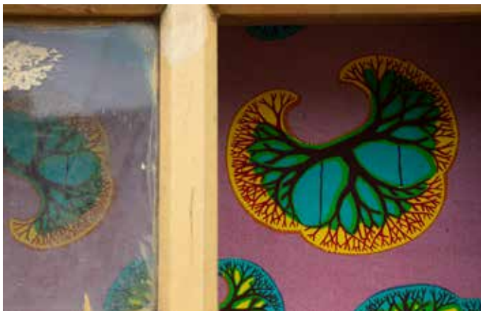
Ibrahim Mahama, détail, 2022