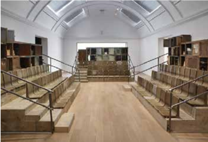
Ibrahim Mahama, The Observer , review of Parliament of Ghosts , July 2019