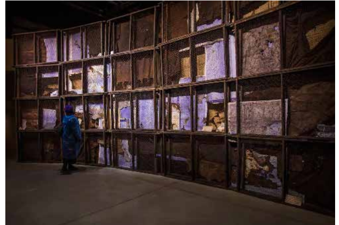
Ibrahim Mahama, Ghana Freedom , Ghana Pavilion, 58 th Venice Biennale, May - November 2019