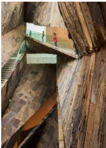
Ibrahim Mahama Fracture , Tel Aviv Museum of Art December 2016 - May 2017