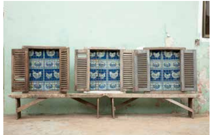
Ibrahim Mahama, vue d'atelier, Tamale, Ghana, 2022