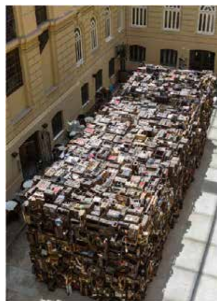
Ibrahim Mahama Ex Africa , Centro Cultural Banco de Brasil, Belo Horizonte October - December 2017