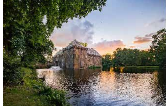
Ibrahim Mahama Kunst & Kohle: Coal Market, Schloss Strünkede, Emschertal- Museum Herne, Stadtische Galerie, Herne, Germany, May - September 2018