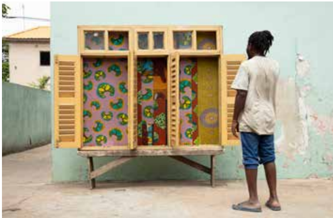
Ibrahim Mahama, vue d'atelier, Tamale, Ghana 2022