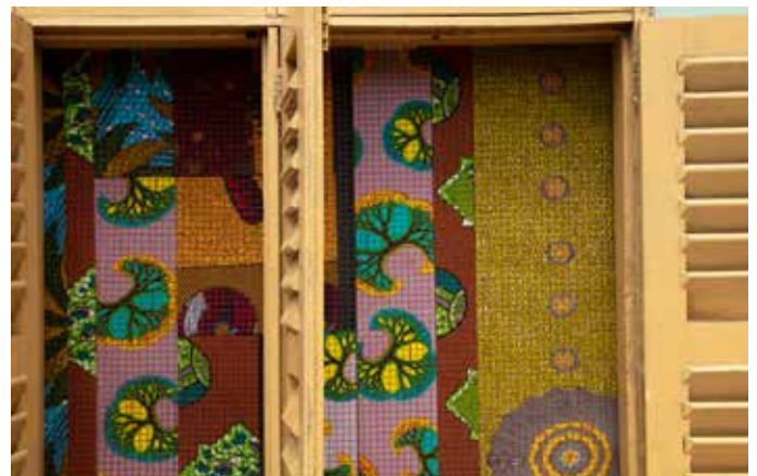
Ibrahim Mahama, détail, 2022